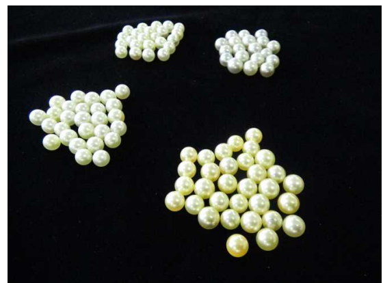
相島でとれた上質・大珠の真珠