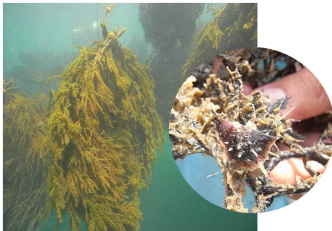
杉葉による天然稚貝採苗

本県相島で、天然稚貝を用いて真珠養殖試験を実施しました。その結果、他産地と比較して上級珠（シミやキズの少ない上物）の割合が高く、また病気が発生していないため長期間の養殖で大型の珠を作ることが可能な、世界的にも貴重な真珠養殖地であることがわかりました。